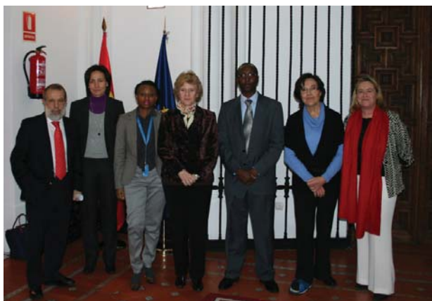
Visita del relator especial de la ONU sobre racismo | Defensor del Pueblo

A partir de ahora, y mediante una clave personal, las víctimas podrán conocer el estado procesal y penitenciario