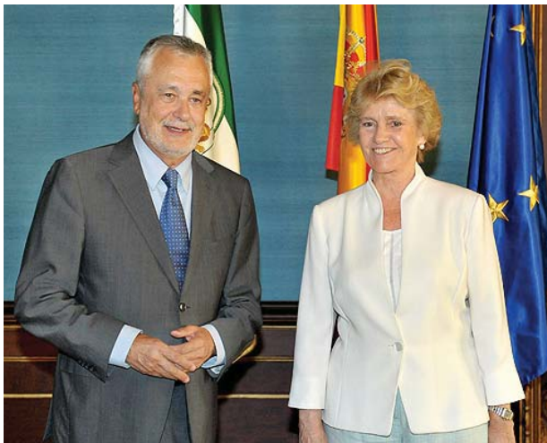
El presidente de la Junta de Andalucía y la Defensora del Pueblo

Con el objetivo de ser la Defensora de todos los ciudadanos por igual, independientemente de su lugar de origen o condición, Soledad Becerril realizó su primer viaje oficial por Andalucía del 6 al 10 de septiembre. Éste ha sido el primero de una serie de viajes oficiales que la llevarán a recorrer todas las comunidades autónomas para conocer de primera mano los problemas de todos los españoles y acercar la Defensoría a todos los rincones de España.