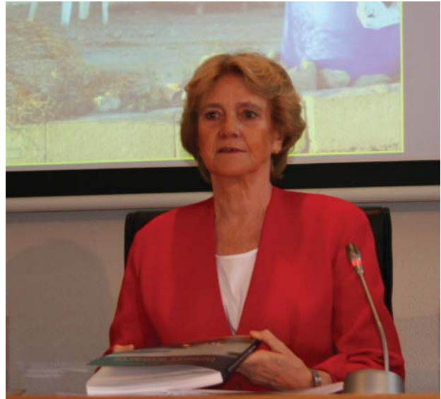
Soledad Becerril presenta el informe a los medios de comunicación

Para la Defensora del Pueblo es importante establecer unas normas comunes para la atención a menores víctimas de trata. Soledad Becerril considera necesario contar con una base de datos de los menores indocumentados que sean localizados al intentar acceder de forma irregular a España. Además, incide en la necesidad de que la llegada de menores sea comunicada de inmediato al Ministerio Fiscal.