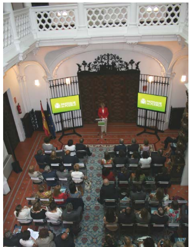
Entre los asistentes, hubo representantes del mundo jurídico y humanitario