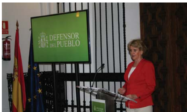
La Defensora, Soledad Becerril, en la presentación del informe