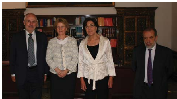
La Defensora y sus adjuntos con el Síndic de Cataluña

La Defensora del Pueblo, Soledad Becerril ha iniciado una serie de contactos con víctimas y asociaciones de víctimas del terrorismo con el objetivo de conocer de primera mano sus problemas e inquietudes. En estos encuentros, también ha participado el adjunto primero, Francisco Fernández Marugán.