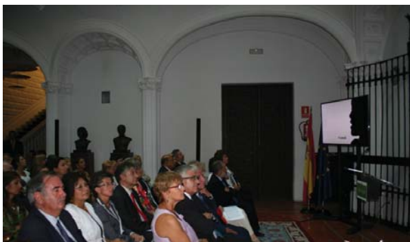
Varios de los asistentes al acto